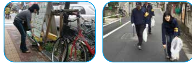
毎月第一日曜には烏山駅前通り商店街。第三日曜には八幡山での清掃活動に取り組んでいます。