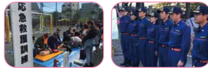
区議としてまた、消防団員として地域の皆さんの安全・安心を守ります！