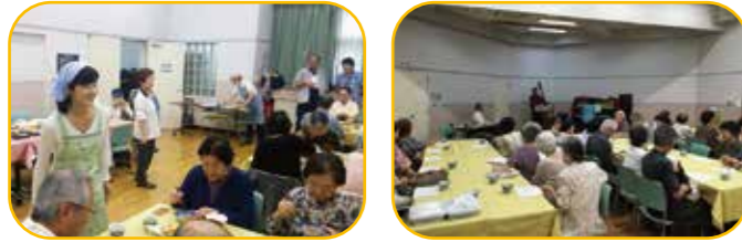
高齢者給食会。月に1回、食事作りや配膳のお手伝いをしています。高齢者の皆様のご要望も直に伺えます。