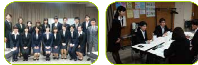
議員になる前から力を入れて取り組んでいる若者支援。就職活動に重要なビジネスマナーの指導や相談も承っています。