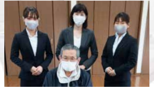
地域の歴史や文化、地域ならではのコミュニティについて生の声を伺いました。