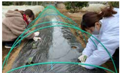
地域の生産緑地農家のお宅で農業体験。真剣な表情のインターン生。