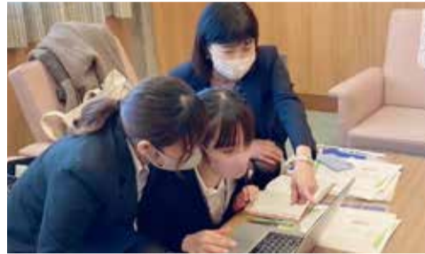
「引きこもりを理解する講演会」に同行していただき、引きこもりについての政策課題を一緒に考えていただきました。