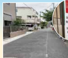
小学校の通学路。地域からご相談をいただき警察につなげて見守りをしてくださることに。(上北沢)

『私道の問題を解決したい』ある不動産会社と地域の方が2年間かかっていた私道をめぐる問題。ご相談をいただいてからすぐに相手側(不動産会社)に何度も出向き地域の方々との対話も重ねさせていただきました。住民説明会もコーディネートして開催。ボタンの掛け違いから2年もかかってしまった案件、ご相談頂いてから、約2ヶ月の短時間両者納得のもと(金銭的な解決ではなく)平和的な解決に繋げる事が出来ました。私道の問題は非常に難しいと言われていますが、解決の糸口は必ずあります。