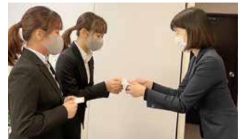
私は誰に対しても心を込めた丁寧な挨拶を心がけています。マナー講師の経験を活かしインターン生にマナー講座を実施。