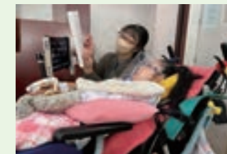
医療的ケア児支援拡充