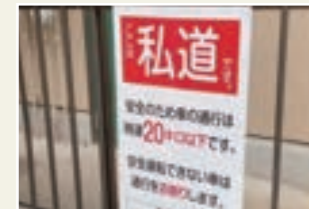
私道をめぐる問題(上北沢)