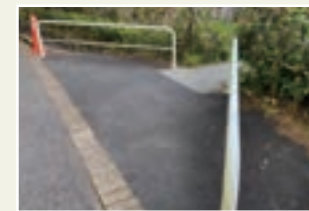
段差のある歩道(八幡山)