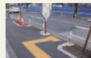
点字ブロックの設置(船橋)