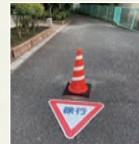
団地内の道路整備(船橋4丁目団地)